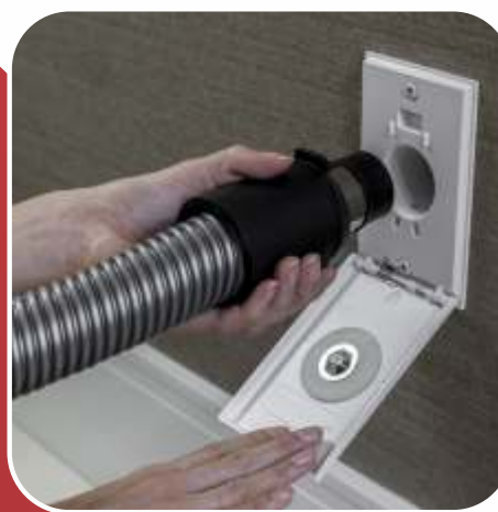
Tomada de aspiração aberta