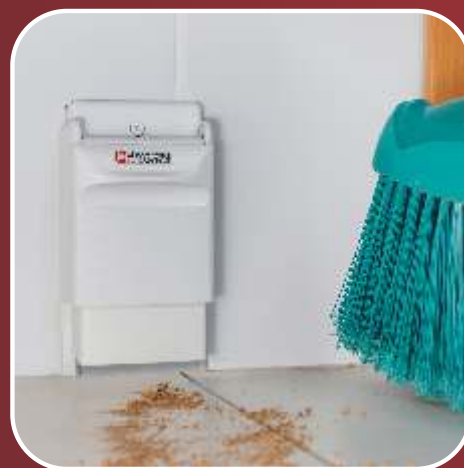
Glutão GII / Pá Tomada