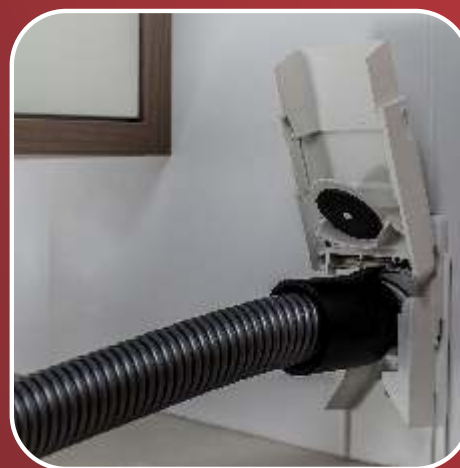
Mangueira conectada Glutão GII / Pá Tomada