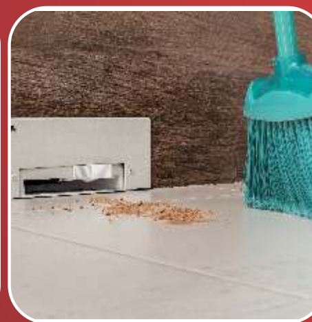
Glutão GI / Pá Automática