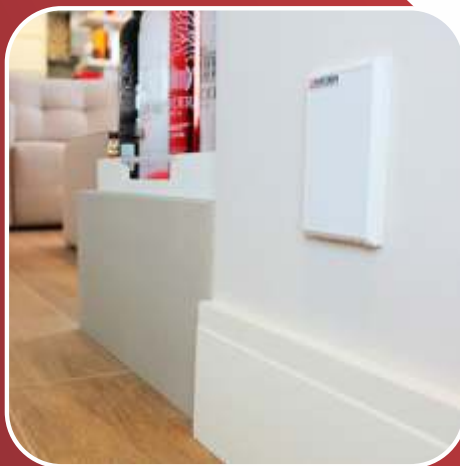
Tomada de aspiração fechada